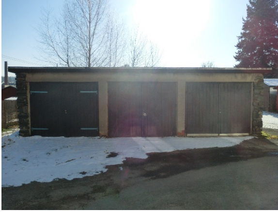
Garage 1 bis 3