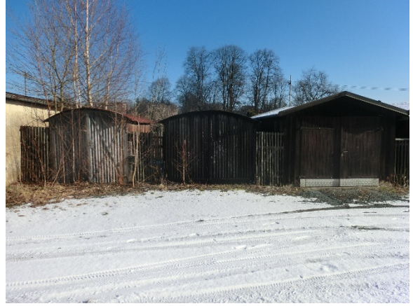
Garage 4 bis 6