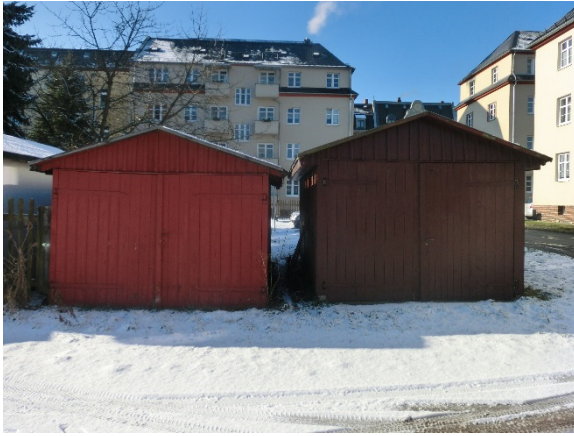
Garage 12 bis 13