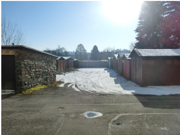
Blick aus nordwestlicher Richtung