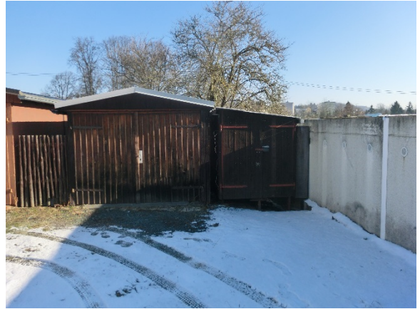
Garage 10 bis 11