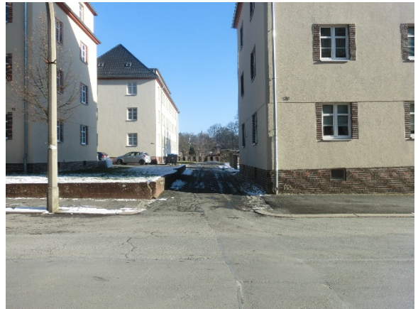
Zufahrt von Karl-Liebknecht-Straße