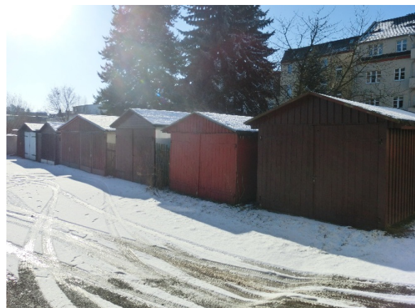
Frontansicht Garage 12 bis 19