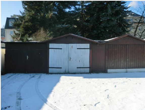
Garage 17 bis 19