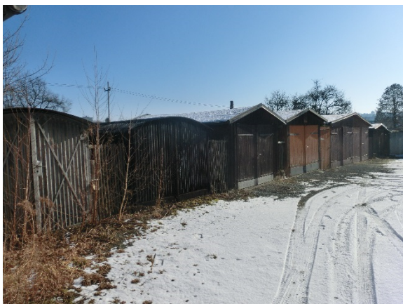
Frontansicht Garage 4 bis 11