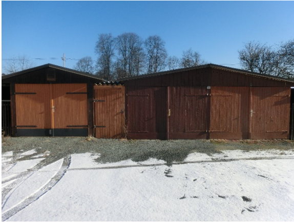
Garage 7 bis 9