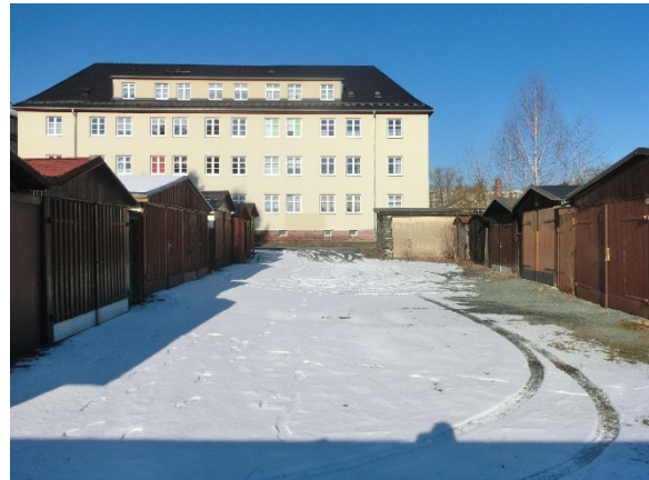
Blick aus südöstlicher Richtung