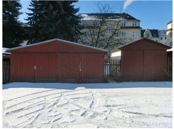
Garage 14 bis 16