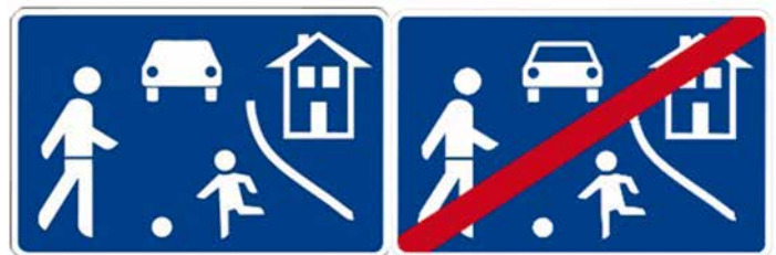
Abb. 1: Kennzeichnung des Beginns und des Endes eines verkehrsberuhigten Bereiches (StVO-Zeichen 325.1/325.2)

Im Juli hat die Stadt Oelsnitz/Vogtl. in der Gerberstraße und am Postberg einen verkehrsberuhigten Bereich eingerichtet. Für die Fahrzeugführer hat dies zur Folge, dass dort nur noch mit Schrittgeschwindigkeit gefahren werden darf. Außerdem darf der Fußgängerverkehr weder gefährdet noch behindert werden. Notfalls muss, wer ein Fahrzeug führt, warten. Radfahrer sind daran ebenfalls gebunden. Weiterhin darf außerhalb der dafür gekennzeichneten Flächen nicht geparkt werden, ausgenommen zum Ein- und Aussteigen oder zum Be- und Entladen. Beim Verlassen des Verkehrsberuhigten Bereichs an dessen Ende gilt für den Fahrzeugführer die gleiche besondere Sorgfaltspflicht, wie bei einer Grundstücksausfahrt und nicht die Vorfahrtsregel.