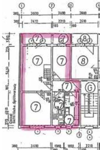
Abb. links: Wohnungsgrundriss