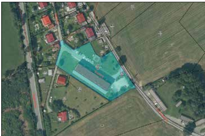
Abb.unten: Lage der Eigentumswohnung