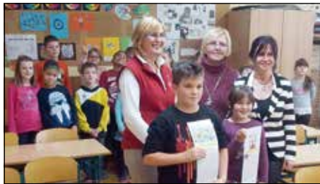
Das Schüler- und Lehrerteam der Grundschule „Am Stadion“