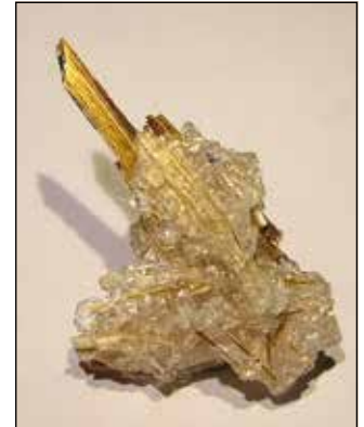
Mineralien aus Übersee. Goldfarbener Rutil sitzt auf Opal. Ein Sammlerstück aus Brasilien

Einmal jährlich zieht es über tausend steinbegeisterte Besucher aus ganz Deutschland nach Oelsnitz. In diesem Jahr öffnen sich am 14. Oktober von 09:00 bis 16:00 Uhr wieder die Türen der Vogtlands-porthalle zu einer der beliebtesten Mineralienmessen in Deutschland. 56 Sammler und Händler präsentieren mineralogische Kostbarkeiten aus der ganzen Welt. Ob Kristallstufen, Edelsteine oder kostbarer Schmuck: hier haben die Besucher die Qual der Wahl. Mit dem Titel „Kristallschätze aus den Vitrinen der Sammler“ widmet sich die diesjährige Sonderschau ganz den Sammlern und ihren Schmuckstücken, die sie oft über Jahrzehnte lang zusammengetragen haben. Unter dem Motto „Lieblingsstücke – Schmuck mit hiesigen Mineralien“ zeigt Bianca Hallebach, Goldschmiedemeisterin und Gestalter aus Plauen Schmuckobjekte in welchen einheimische Mineralien und Edelsteine gefertigt sind. Für „Junge Geologen“ wird vor der Vogtlands-porthalle erneut das beliebte Angebot „Achate suchen und Aufschlagen“ vorgehalten. Der Eintritt beträgt für Erwachsene 3,50 Euro, Kinder zahlen hier lediglich einen Euro. Jeder Besucher nimmt zudem wieder mit der Eintrittskarte an der Verlosung wertvoller Preise teil. Die Eintrittskarte berechtigt ebenfalls am Tag der Börsenveranstaltung zum ermäßigten Eintritt in die Museen auf Schloß Voigtsberg.