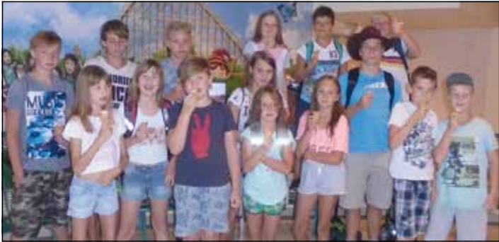
Jungen und Mädchen des Sommercamps beim Besuch des IFA-Ferienparks

Achtzehn Kinder aus dem Vogtland erlebten eine spannende, heiße und abwechslungsreiche fünfte Ferienwoche in den vergangenen Sommerferien. Das Zeltlager schlugen die 6-10 jährigen Mädchen und Jungen auf dem Sportplatz in Lauterbach auf, Veranstalter des erlebnispädagogischen Sommercamps war das Beratungszentrum „Oberes Vogtland“ der AWO Vogtland Bereich Reichenbach e.V. Neben der Schatzsuche auf Schloß Voigtsberg vergnügten sich die Kinder bei Spaß und Spiel im Elstergarten Oelsnitz und an der idyllischen Talsperre Pirk. Beim Ausflug nach Plauen in die Weberhäuser zeigten die Kinder beim Kerzenziehen, Töpfern und der Holzgestaltung vielerlei Kreativität und handwerkliches Geschick. Dem fünfköpfigen Betreuerteam ging es neben Spiel und Spaß auch um die Förderung altersübergreifender sozialer Kompetenzen, die Entwicklung des Selbstbewusstseins und der Selbstständigkeit sowie darum, die individuellen Fähigkeiten und Fertigkeiten jedes Kindes zu stärken. Deshalb waren die Selbstversorgung im Camp, das gegenseitige Helfen und die Rücksichtnahme auf die Bedürfnisse jedes Einzelnen wichtige Bestandteile und die Kinder und Betreuer erlebten sechs wunderschöne Sommertage. Die Organisatoren des Camps möchten sich ausdrücklich noch einmal bei allen Helfern und Sponsoren bedanken, ohne deren Unterstützung die Durchführung der beiden Wochen Feriencamp mit insgesamt 34 Kindern und Jugendlichen nicht möglich gewesen wäre.