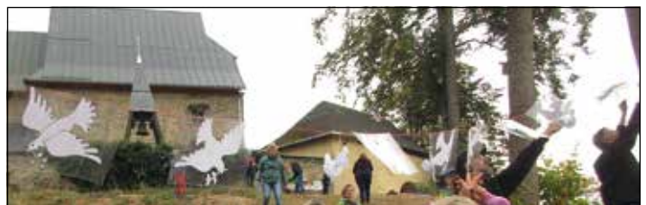
Die Friedenstaube als Symbol anlässlich der Kinderwanderung

Traditionell am ersten Samstag im September luden die Wanderfreunde Triebeltal zur nunmehr elften Auflage der Kinderwanderung ein. Bei bestem Wetter trafen sich 13 Kinder und Jugendliche und 18 Erwachsene am Kulturhaus Triebel, um mit ihrer Teilnahme unter dem Motto „Kinder wandern für den Frieden“ zur Würdigung dieses Tages beizutragen. Mitorganisatorin Andra Ittner hatte ein nicht ganz einfaches Quiz mit Fragen rund um den Weltfriedenstag für die Erwachsenen vorbereitet. Unter der Leitung von Rainer und Andra Ittner sowie Ingrid Richter ging es auf die ca. 2,5 km Strecke, die auch mit sportlichen Einlagen, u.a. am Waldbad Triebel und Mühlfranzens Teich, aufwartete. An der Endstation am Kirchberg konnten sich die kleinen und großen Wanderer bei Wienern, Tee und kleinen Friedenstaubengebäck von den „Strapazen“ erholen und stärken. Dann wurden viele vorgebastelte weiße Friedenstauben aufgefädelt und zwischen zwei Bäumen aufgehängt. Der Höhepunkt war jedoch das Aufsteigen der zehn Brieftauben des Züchters Joachim Wöllner aus Ebmath vor der fertig gestellten Triebler Kirche. Anschließend bekam jedes Kind eine kleine Urkunde in Form einer gedruckten vierseitigen Postkarte mit Friedenstaube und dem Liedtext der kleinen weißen Friedenstaube überreicht.