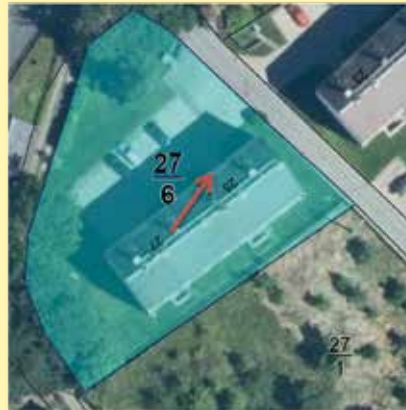
Abb.: Lage der Eigentumswohnung

Straße: Hauptstraße 25 Wohnungsnummer: 14 Geschoss: Erdgeschoss, rechts Keller: Keller Nr. 14 PKW-Stellplatz: Stellplatz Nr. 14