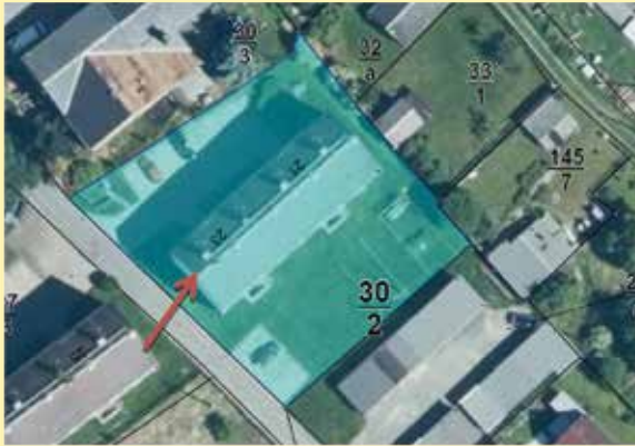
Abb.: Lage der Eigentumswohnung

Straße: Hauptstraße 23 Wohnungsnummer: 12 Geschoss: 2. Obergeschoss, rechts Keller: Keller Nr. 12 PKW-Stellplatz: Stellplatz Nr. 12