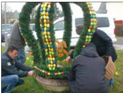
Die Osterkrone auf dem Possecker Dorfplatz

Bei frostigen Temperaturen wurde am Palmsonntag die Osterkrone auf dem Possecker Dorfplatz aufgestellt. Zum Glück befindet sich das Domizil des Heimatvereins Posseck e.V. in der Hager-Scheune gleich nebenan, so dass es die vielen Gäste im Anschluss bei Kaffee und Kuchen dorthin zog. Für Abwechslung sorgte u.a. ein Schätzspiel, während die Kinder schöne Osterbilder malten und dafür eine Belohnung vom Osterhasen bekamen. Der nächste Höhepunkt steht bereits vor der Tür: am 1. Mai wird ab 13:30 Uhr der Maibaum auf dem Dorfplatz in Posseck aufgestellt.