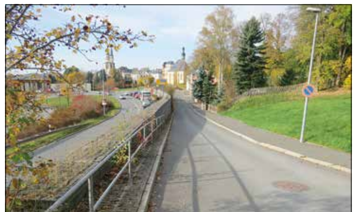
Christian Schubert, „Freie Presse“ Oberes Vogtland

Heinzmann, Walter (1987): Straßen und ihre Namen: Dr.-Fickert-Straße. Freie Presse Oelsnitz vom 29. Dezember 1987.