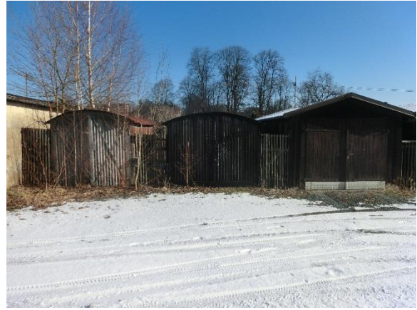
Garage 4 bis 6