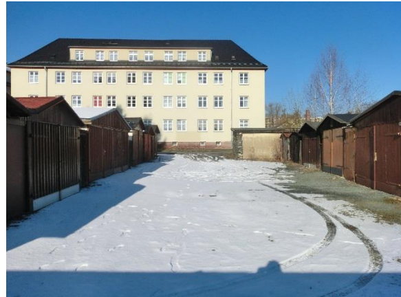
Blick aus südöstlicher Richtung