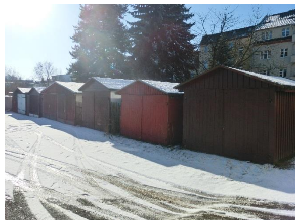
Frontansicht Garage 12 bis 19