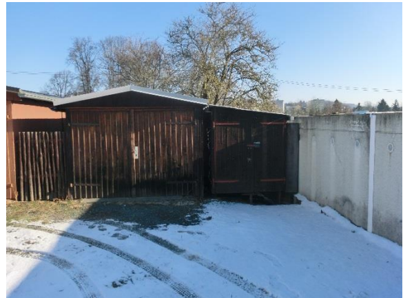
Garage 10 bis 11