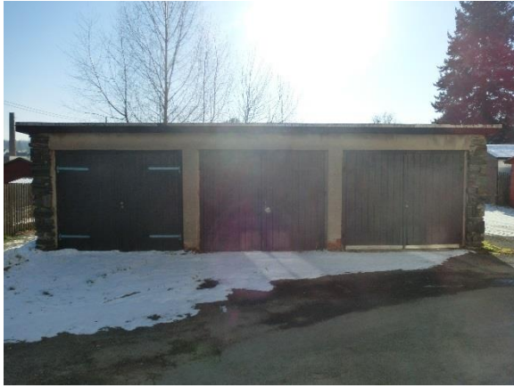
Garage 1 bis 3