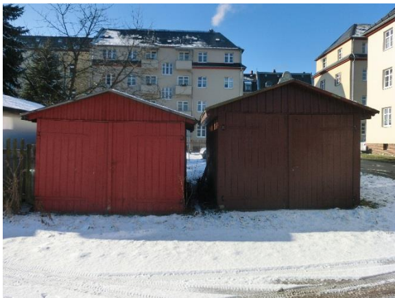
Garage 12 bis 13