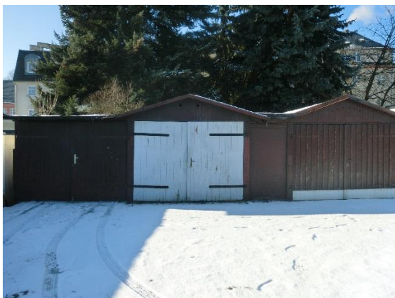
Garage 17 bis 19