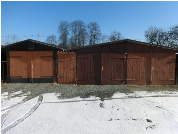
Garage 7 bis 9