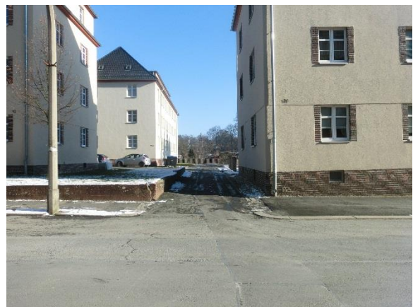
Zufahrt von Karl-Liebnecht-Straße