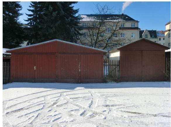
Garage 14 bis 16