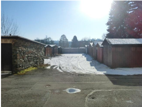
Blick aus nordwestlicher Richtung