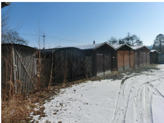
Frontansicht Garage 4 bis 11